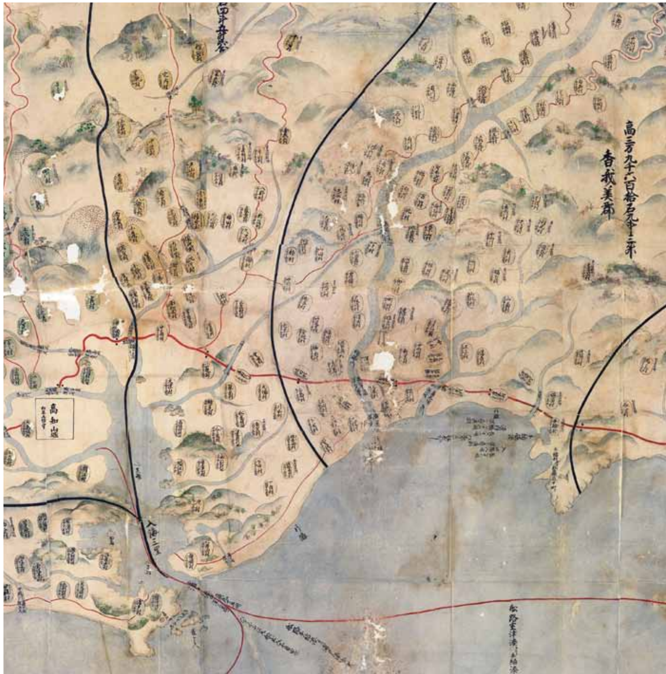
『元禄土佐国絵図』(高知市立市民図書館蔵)より、香我美郡・長岡郡・土佐郡の平野部

上記表は「土佐七郡本田新田地払帳(元禄地払帳)」(17世紀末)の石高表記による (松本瑛子編集・発行「本田新田地払帳」1980年を参考に作成)