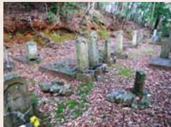
4 一木権兵衛・横山家墓所