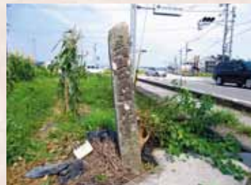
7 郡境の碑(2基のうち東側の碑)