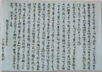
松平春嶽撰 山内容堂追悼文

「公武合体主義を堅持して幕末の政治舞台に活躍した容堂の政見、立場などはその政友春嶽、宗城にあてたものだけに率直に告白され、吐露されている。これは幕末期の複雑な政局とその推移を理解し、判断するため、の好個の史料だともいえるし、また公武合体論者としての容堂の心事を思量する不可欠の文書でもある。」