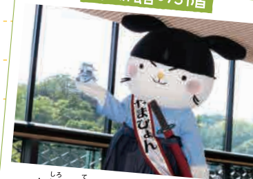
お城を手のひらにのせてパチリ