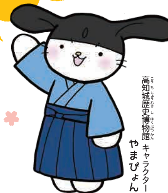
高知城歴史博物館 キャラクタ ー やまぴょん

つぎ 次のページから、さっそく はくぶつ かん 博物館 あん ない をご案内するよ！ ばくについてきてね。