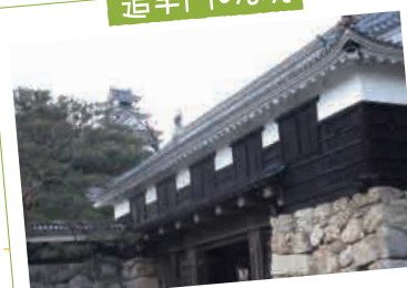
天守と追手門のすてきなセット