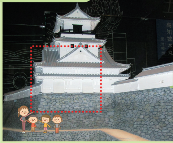
てんしゅ ひがしがわ 天守の東側