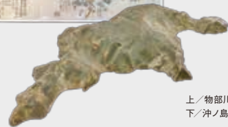
上/物部川絵図(安芸市立歴史民俗資料館蔵) 下/沖ノ島山形模型(高知県立歴史民俗資料館蔵)

野中兼山は土佐藩主山内家の執政家老で、新田開発や港湾整備・殖産興業など、土佐の地域開発・国力増強を推し進めた人物です。本展では、兼山ゆかりの資料を幅広く紹介し、兼山の事績とその時代を振り返ります。