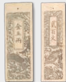
高知藩会計司札(刈谷コレクション) 左/私札 金5両、右/藩札 銭200文

財政難や流通通貨の不足など、“お金がない”という問題に接した時、江戸時代の人びとは地域通貨を発行することで、経済を回していました。本展では、土佐の藩札と私札を中心に、四国各藩の藩札や近代貨幣までを広く展示し、お金の歴史を紹介します。