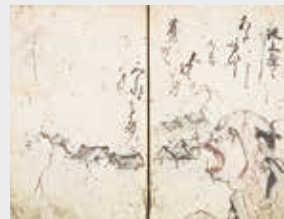
絵本大変記 (高知県立図書館蔵)