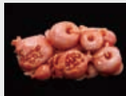
石榴形帯留 (全て個人蔵)