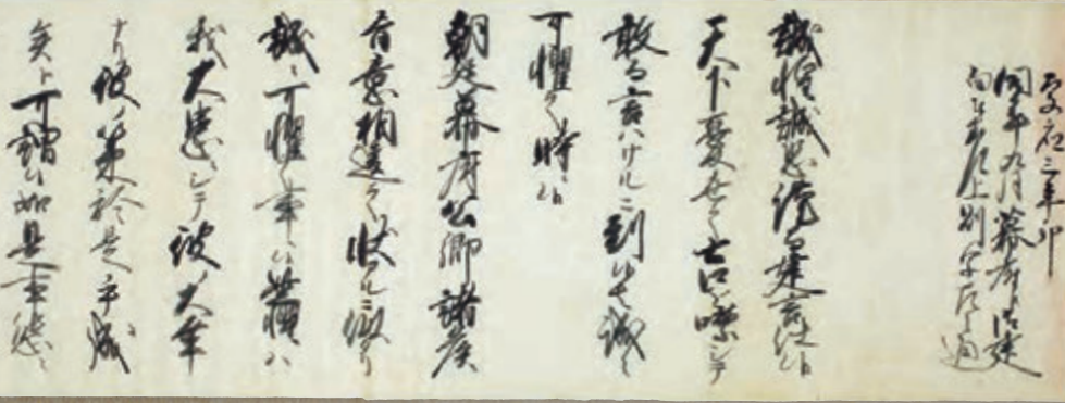
大政奉還建白書写 慶応3年(1867)