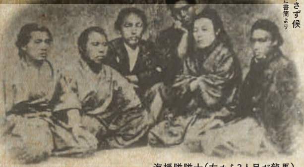
海援隊隊士(左から3人目が龍馬)