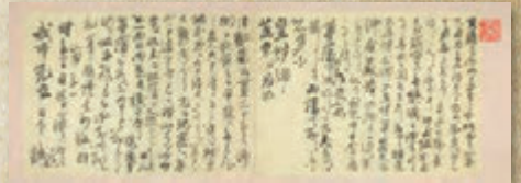
久坂玄瑞書状 武市半平太宛 文久2年(1862)1月21日