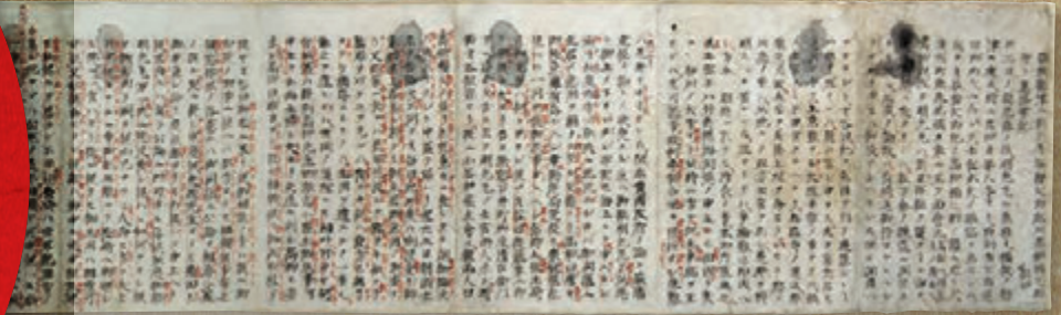
備後鞆津応接筆記(海援隊いろは九事件始末書)慶応3年(1867)

天下に事をなすものは、 ねぶともよくよくはれずては 針へは臆をつけ申さず候 龍馬が姉乙女に宛た書簡より