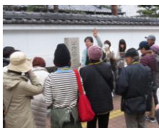
城下町散策会 時期: 秋