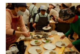
日曜市料理教室 時期: 5月~2月