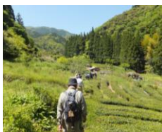
地域散策会 時期: 春~夏

高知県内各地の史跡や歴史的景観を、当館学芸員・企画員の案内のもと見学してみませんか?