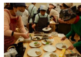
日曜日料理教室 時期：6月～2月