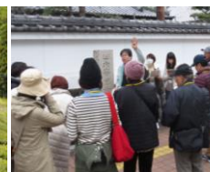
城下町散策会 時期：秋