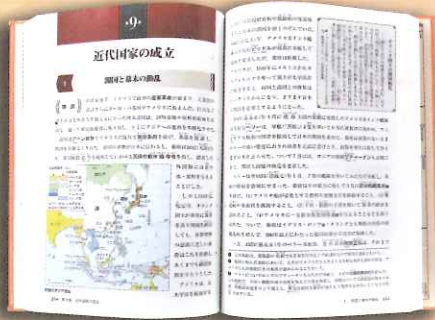
山川出版社「解説日本史」