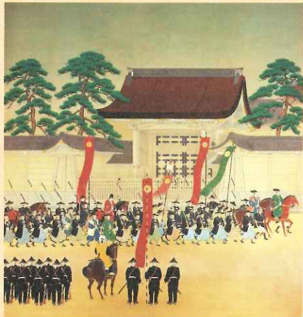
高取稚成「大総督熾仁親王京都進発」 (聖徳記念絵画館蔵)