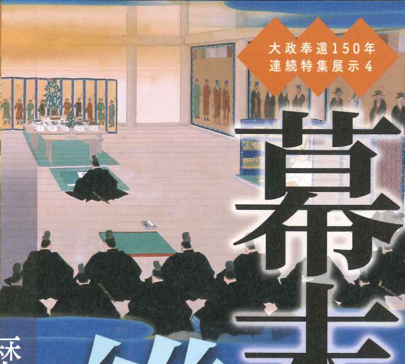
左 邨田丹陵「大政奉還」(聖徳記念絵画館蔵)/右 乾南陽「五箇条の御誓文」