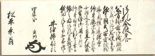
井伊直弼大老奉書 (山内豊信隠居関係)