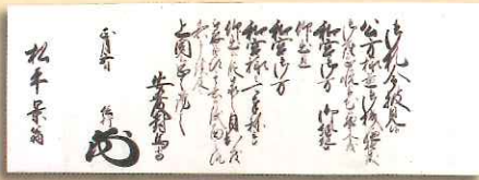
安藤信行老中奉書 (和宮降嫁関係)