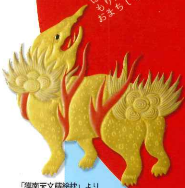
「猿南天文蒔絵枕」より