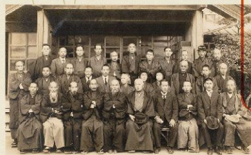
土佐史談会会員集合写真

全国的な郷土史への関心の高まり、史誌編纂の必要性などを受けて、明治45年(1912)に創設された『土佐史談会』が発行する機関誌。 (高知市民図書館所蔵)