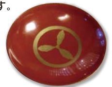
展示資料「山内侯爵歓迎会の杯」