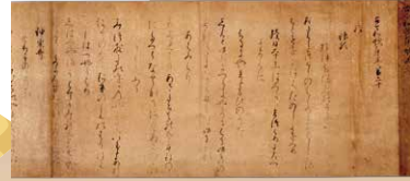
古今和歌集 卷第廿(高野切本)