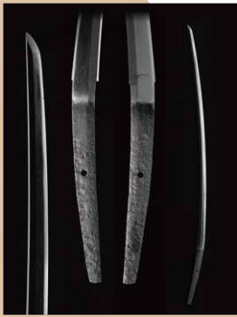
太刀 銘 国時