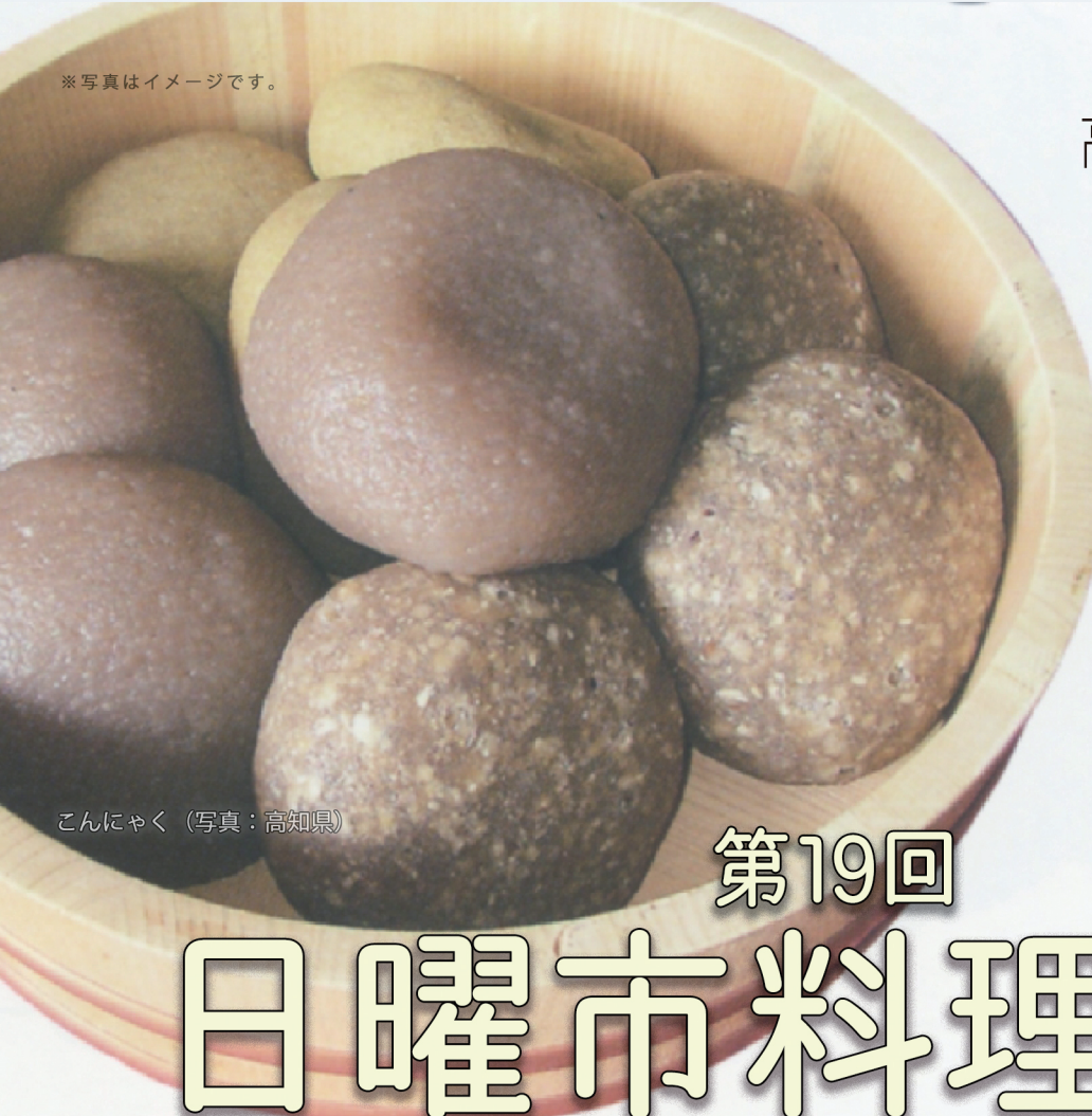
こんにゃく