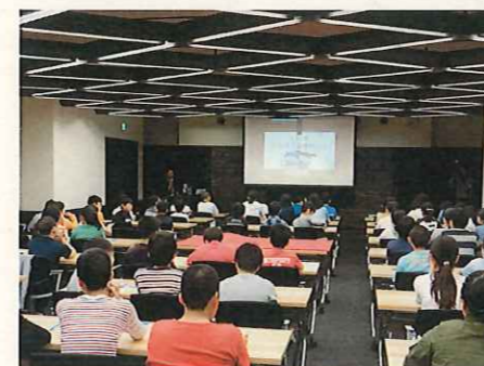
博物館ガイダンス

※来館の事前学習、あるいは事後学習に、学校への出前授業を組み合わせることも可能です。