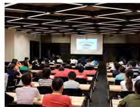
博物館ガイダンス

※上記の学習プログラムは、参加校の規模や新型コロナウイルスの感染状況等によってはご利用いただけない場合もございます。あらかじめご了承ください。