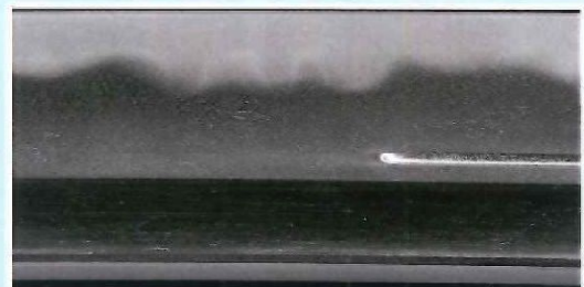
写真2 一国兼光の互の目