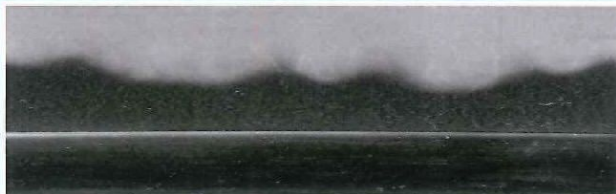
写真3 一国兼光の丁子