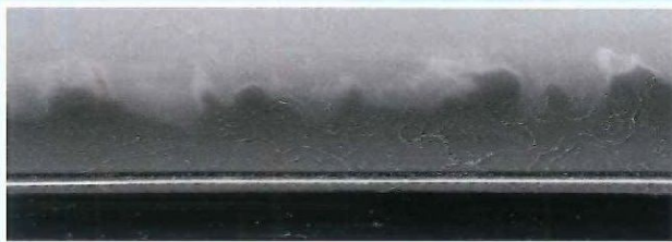
写真1 康光の鍛え肌