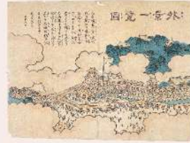
外景一覽図 徳島市立徳島城博物館蔵