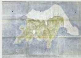
沖之島・姫島・鵜来島 三島全形絵図より 沖之島部分