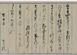
廃藩置県決行を二日前に知らされ、 意外の大変革に狼狽したと記す