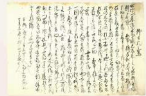
御高札之写(稲田騒動関係)