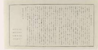
独立置県旨趣要領 高松松平家歴史資料 香川県立ミュージアム保管