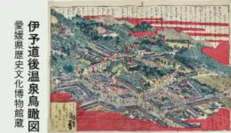
伊予道後温泉鳥瞰図