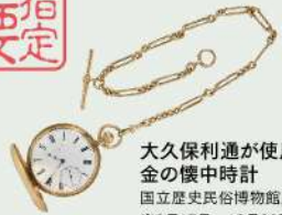
大久保利通が使用した 金の懐中時計 国立歴史民俗博物館蔵 ※9月17日～10月26日