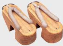
伝西郷隆盛所用下駄 個人蔵 高知県立歴史民俗資料館保管