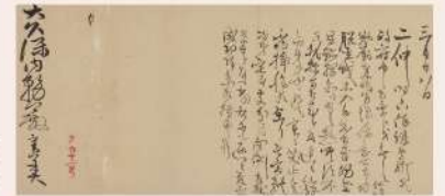
三条実美書簡 大久保利通宛 (追伸部分) 国立歴史民俗博物館蔵 ※10月27日～11月29日