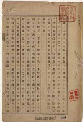
結社合力! 天下ノ民会ヲ立ンテ 立志社設立趣意書 (明治7年(1874)) 高知市立市民図書館

民権派と反民権派、 双方の政社の活動を紹介します企画展。 自由民権運動とは如何なる運動なり哉： 演説会や学習活動を行い、運動に奔走。 反民権派と称される彼らもまた、 立志社とは異なる主張をもつ政社。 社会のあり方を学ぶために集い、結びつきを強めた。 政治熱が高まると、人々は政治や 様々な政社が、新聞や演説会など言論の力で、 自らの主張を展開。 多くの政治結社(政社)や学習グループ(夜学会など)が勃興。 全国一の結社数を誇る高知。 諸君は来館あらんことを乞