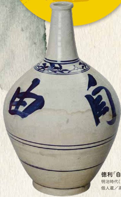
徳利「自由勝利」 明治時代(19世紀) 個人蔵/高知市立自由民権記念館保管

民権派と反民権派、 双方の政社の活動を紹介します企画展。 自由民権運動とは如何なる運動なり哉： 演説会や学習活動を行い、運動に奔走。 反民権派と称される彼らもまた、 立志社とは異なる主張をもつ政社。 社会のあり方を学ぶために集い、結びつきを強めた。 政治熱が高まると、人々は政治や 様々な政社が、新聞や演説会など言論の力で、 自らの主張を展開。 多くの政治結社(政社)や学習グループ(夜学会など)が勃興。 全国一の結社数を誇る高知。 諸君は来館あらんことを乞