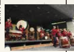
明德義塾中学・高等学校和太鼓部

県内の中高生、大学生が城博の日を華やかに彩ります！ 日時／3月2日(土)13時 明德義塾中学・高等学校和太鼓部 《3月3日(日)》 9時 土佐和太鼓文化研究所「響館」龍ステージ 9時30分 高知丸の内高等学校音楽科 10時 高知大学合唱団 会場／北ステージ 当日どなたでもご覧いただけます。