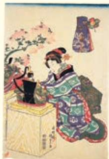
『豊歳五節句遊』桃の節句

正月7日の人日(七草の節句)、3月3日の上巳(桃の節句)、5月5日の端午(菖蒲の節句)、7月7日の七夕(七夕祭り)、9月9日の重陽(菊の節句)など、日本に古くから伝わる五節句の習俗について、歴史と民俗の視点からご紹介いたします。