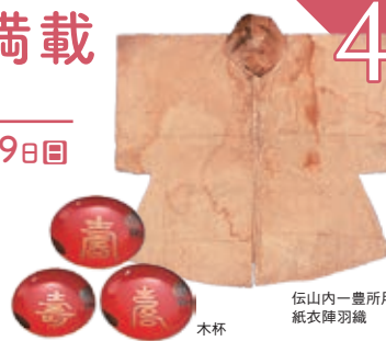
伝山内一豊所用紙衣陣羽織 木杯

新春を彩るおめでたい美術品や干支(巳)にちなんだもの、初出しとなる新収蔵資料を展示します。城博コレクションで一年を縁起よくお迎えください。