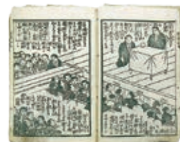
板垣退助演説の図「民権泰斗 板垣君近世新聞」より 高知市立自由民権記念館蔵