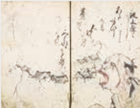
絵本大要記(高知県立図書館蔵)