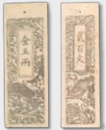
高知藩会計司札(刈谷コレクション) 左／鯨札 金5両、右／鯉札 銭200文

財政難や流通通貨の不足など、“お金がない”という問題に接した時、江戸時代の人びとは地域通貨を発行することで、経済を回していました。本展では、土佐の藩札と私札を中心に、四国各藩の藩札や近代貨幣までを広く展示し、お金の歴史を紹介します。