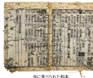
虫に食べられた和本

今年度は、文化財に大きな被害を与える天敵「虫」に注目します。生息環境から食べ物の好み・食べ方まで様々な虫たち。講座では、文化財を食害する虫とその生態を学びながら、虫から文化財を守る博物館の取り組みを紹介します。