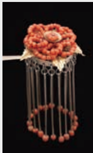
牡丹形玉飾りびらびら簪