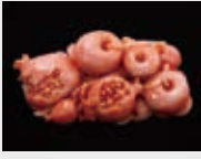
石榴形帯留 (全て個人蔵)