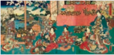
「源氏十ニヶ月之内 弥生」

新春を祝うおめでたい意匠の美術品や桃の節句にかざる雛人形や雛道具など、春にちなんだ資料を展示します。春の訪れをジョー・ハクで感じてください。