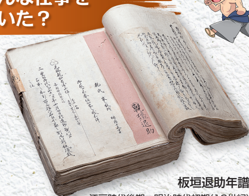
板垣退助年譜 江戸時代後期~明治時代初期(19世紀) 高知県立高知城歴史博物館