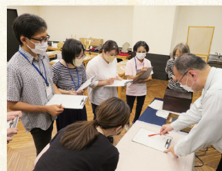
養成講座 資料調査実習の様子